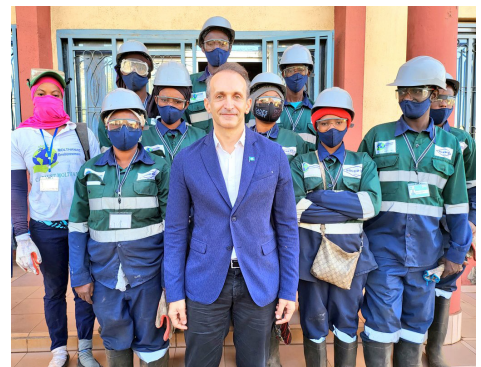
Projet de gestion des déchets par une PME