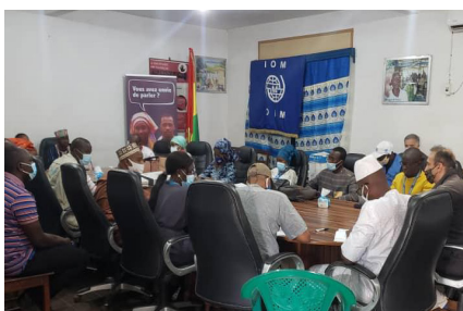
Entretien avec le personnel local du SNU à Labé