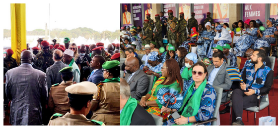
Vibrant hommage aux femmes et filles guinéennes à l'occasion du 08 mars