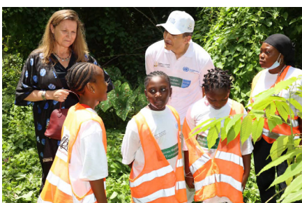
Célébration de la Journée Mondiale de l'Environnement