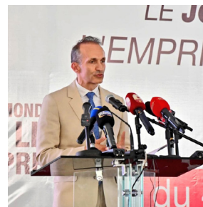
Célébration de la Journée sur la liberté de la Presse