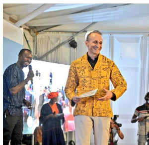
Participation aux 72 H du livre