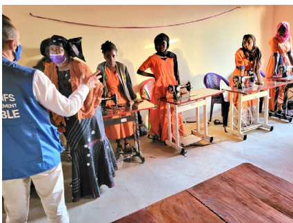
Inclusion des filles vivant avec handicap