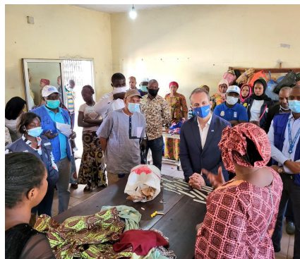
Centre d'autonomisation des femmes