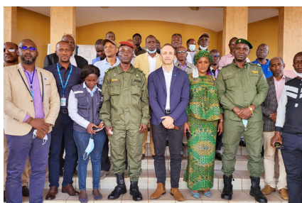
Accueil des autorités locales à Mamou