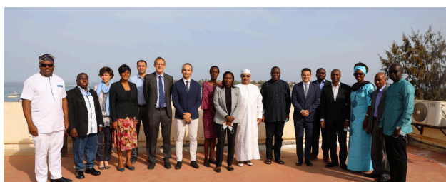
Mars 2022 à Dakar - UNOWAS et les RC, ensemble pour la paix la sécurité et le développement