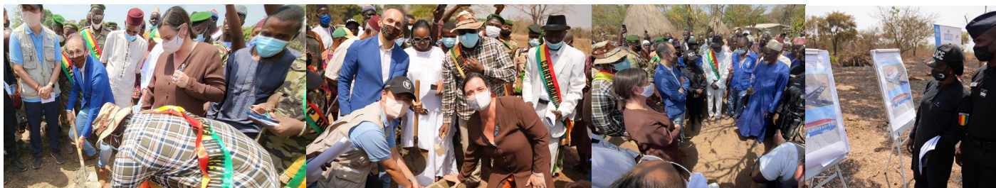
18/02/2022: Lancement du projet transfrontalier «Guinée / Sierra Léone » et gestion des frontières- financé par le PBF