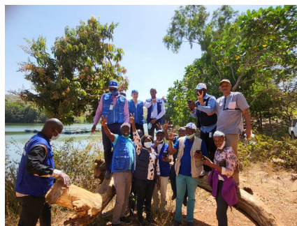
Visite de terrain avec l'équipe UN de Mamou