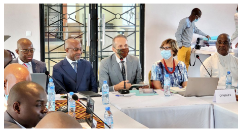
Innovation: Atelier innovant sur la prospective pour reprendre aux priorités de la transition