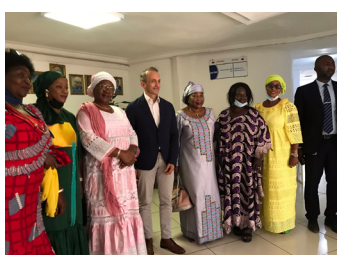
Audience avec la plateforme « La Guinéenne en Politique »