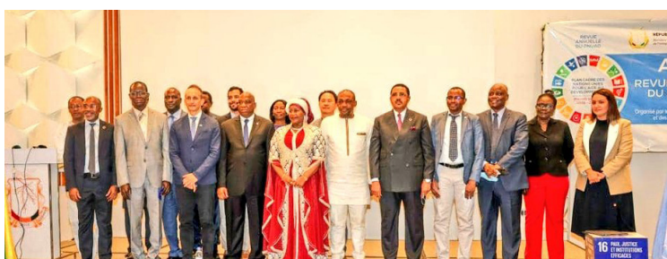
Signature du Plan de Travail Annuel des Nations Unies