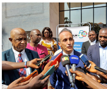
Atelier Préparatoire Stockolm + 50